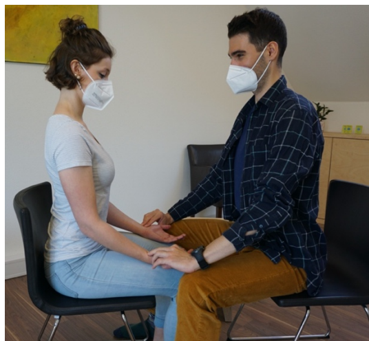
Abbildung 3: Endposition des costoclaviculären Manövers in übertrieben aufrechter Haltung