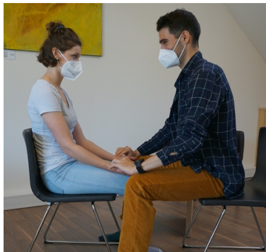
Abbildung 2: Ausgangsposition des costoclaviculären Manövers in entspannter Position

Danach wurden der Flexionstest der ersten Rippe und das costoclaviculäre Manöver, wie in Kapitel 2.2.1 beschrieben, durchgeführt (siehe Abbildung 2 und 3).